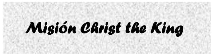
Misión Christ the King