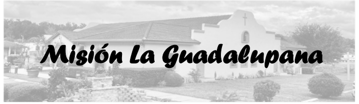
Misión La Guadalupe

Oficina de Ministerio Hispano 352-629-8092 ext. 3380